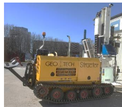
Figur 3 Bild på borrhandsvagn

Läs mer på: vaxer.stockholm/projekt/kungsholmen/ karlbergskanalen-strandpromenad/